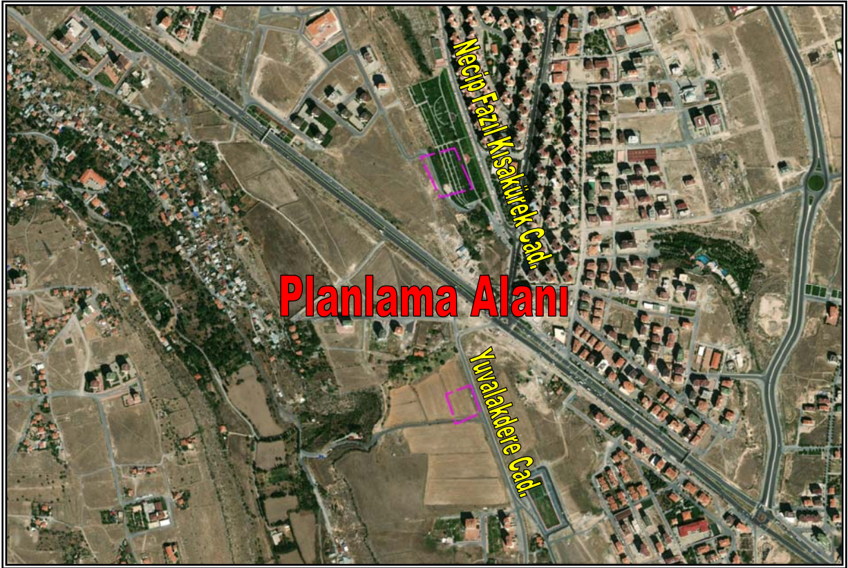
Resim 1: Planlama Alanının Konumu

Planlama alanı düz bir arazi yapısına sahiptir. Planlama alanının Germir Mahallesi sınırları içerisinde kalan kısmında herhangi bir yapılaşma görülmemiş olup boş arazi statüsünde iken Gök kent Mahallesi sınırları içerisindeki kısmı park olarak kullanılmaktadır. Planlama alanının yakın çevresinde ise konut ve işyeri kullanımlı yapılar, park ve boş araziler yer almaktadır.