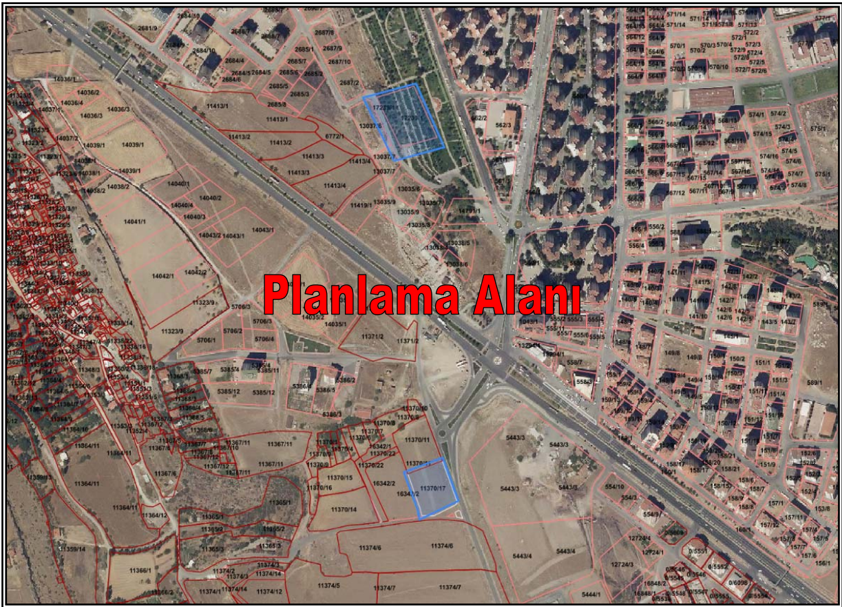
Resim 3: Planlama Alanının Mülkiyet Durumu

Planlama alanı; tapuda Melikgazi İlçesi, Germir Mahalleleri sınırları içerisinde, mülkiyeti Kayseri Büyükşehir Belediyesine ait 11370 ada 17 parsel numaralı taşınmaz ile Gökkent Mahallesi sınırları içerisinde 17239 ada 1 parsel (eski 14243 ada 1 parsel) numaralı taşınmaz üzerinde bulunmaktadır. (Bkz. Resim 3)